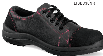
Liberty noire basse S3 SRC LIBBS30NR