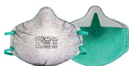
BLS Zer0 30 NV

PRODUITS DE PROTECTION RESPIRATOIRE MODÈLES DISPONIBLES