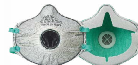
BLS Zer0 31C