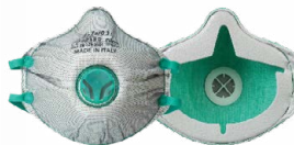
BLS Zer0 31