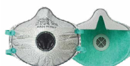
BLS Zer0 30C