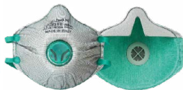
BLS Zer0 30