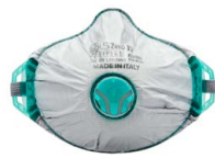
BLS Zer0 32