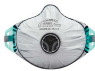
BLS Zer0 32 C