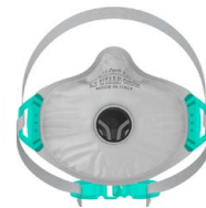
BLS Zer0 32C - Flame Retardant