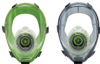
Masques complets BLS 5400 - BLS 5150