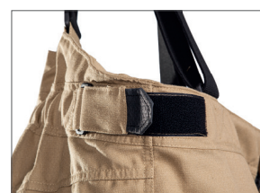
Taille ajustable par boucles