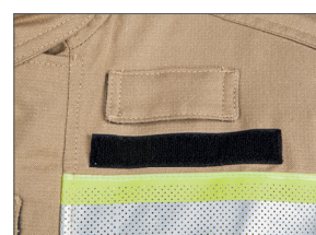
Support multifonctionnel pour lampe et autres outils