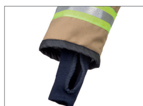
Manchette en tricot avec passe pouce intégré

Cette tenue est la première à être équipée d'une puce RFID pour sa traçabilité et son contrôle.