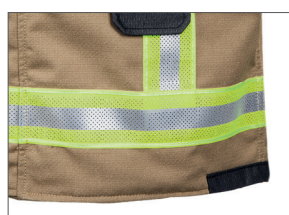
Bandes de signalisation résistantes