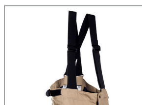
Bretelles réglables et amovibles