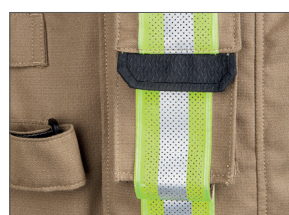
Poche pour radio