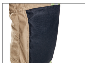
Renforts de genoux ergonomiques intégrés