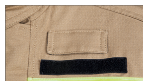
Multifunctionele houder voor lamp en andere tools