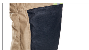
Ingewerkte ergonomische kniestukken