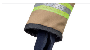
Gebreide mouwcuff met geïntegreerde duimlus

Voor een uitgebreide kennismaking met dit nieuwe pak, contacteer ons voor een demo.